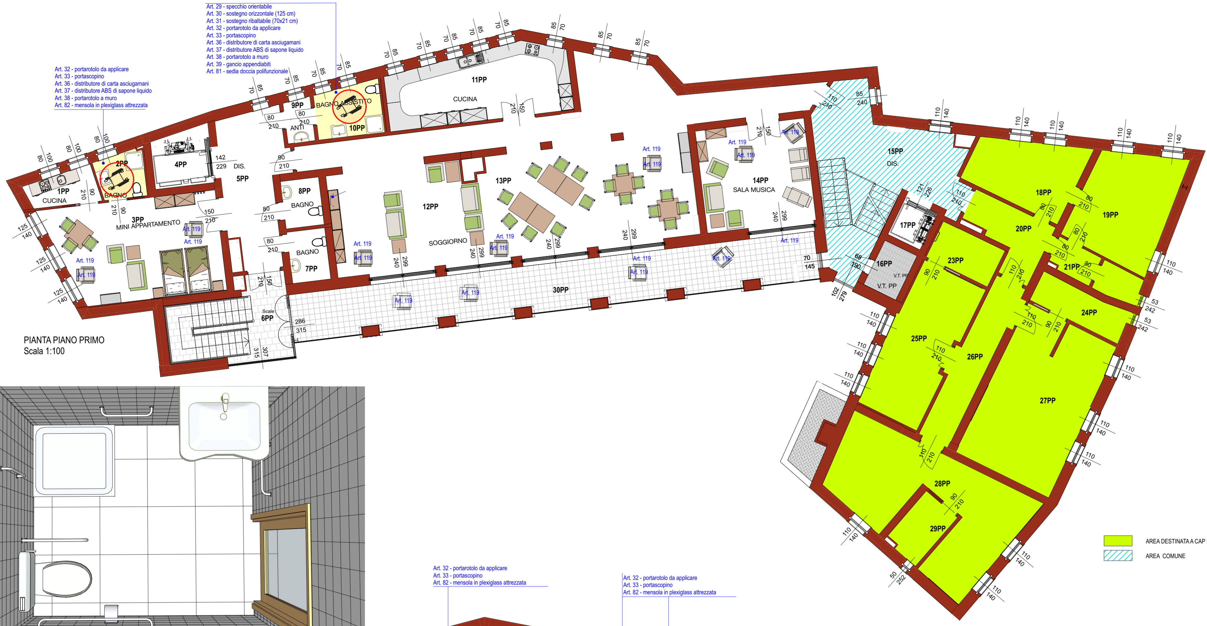
PIANTA PIANO PRIMO Scala 1:100