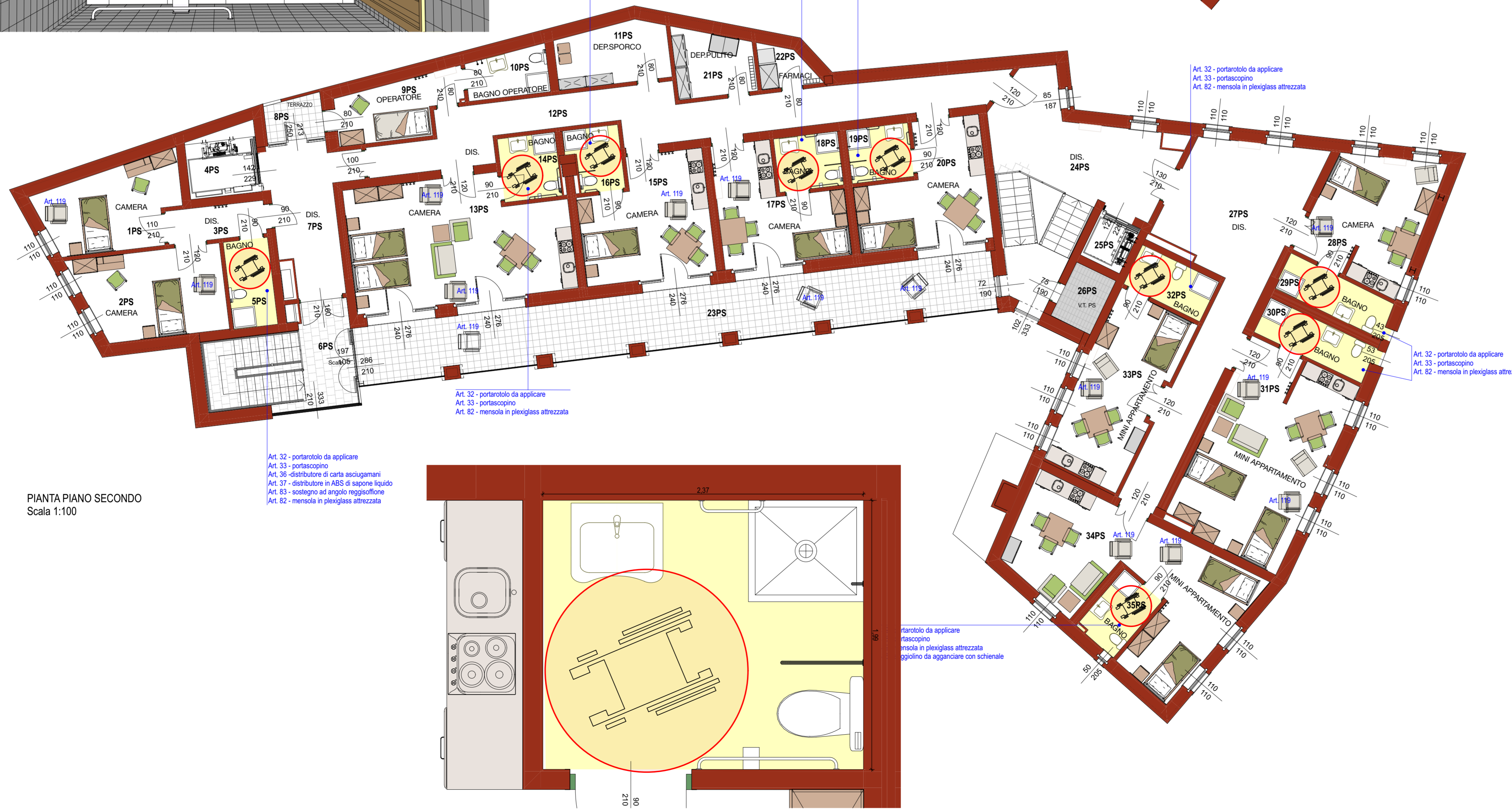
PIANTA PIANO SECONDO Scala 1:100